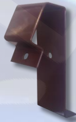
Kopėčių laikiklis universalus, koja