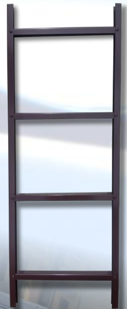
Kopėčios 1,25 m

Kopėčių atramos viena linija išdėstomas kas 1,0m-1,20m ir varžtais arba sraigtais tvirtinamos prie stogo konstrukcijų. Kai montuojama ant molio ar betono čerpių naudojami papildomi laikikliai, taip pat tenka sumontuoti papildomus grebėstus. Kiaurymės varžtams sandarinamos gumine tarpine, dedama tarp atraminės plokštelės ir stogo dangos, ir hermetikais.